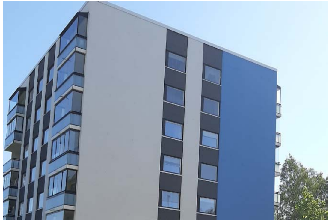
Vaasan kaupungin uusi vuokratonttien hinnoittelu voi nostaa vanhojen taloyhtiöiden yhtiövastikkeita roimasti. Etenkin eläkeläisiä hintojen shokkikorotukset järkyttävät.

Vaasan vetovoimaisuus ei lisäännä asukkaita kurittamalla - tämä tulisi